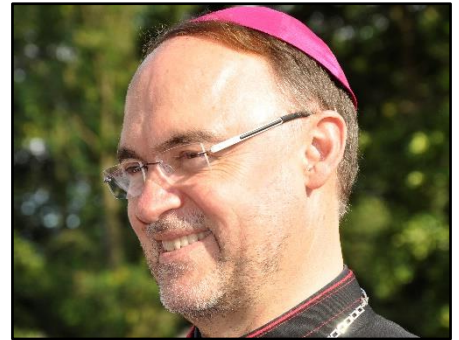
Weihbischof Rolf Lohmann ist in der Deutschen Bischofskonferenz für Umwelt- und Klimafragen zuständig.

Weihbischof Rolf Lohmann ist im Bistum Münster Regionalbischof für Niederrhein und Recklinghausen und als Umweltbischof in der Deutschen Bischofskonferenz für Umwelt- und Klimafragen zuständig: